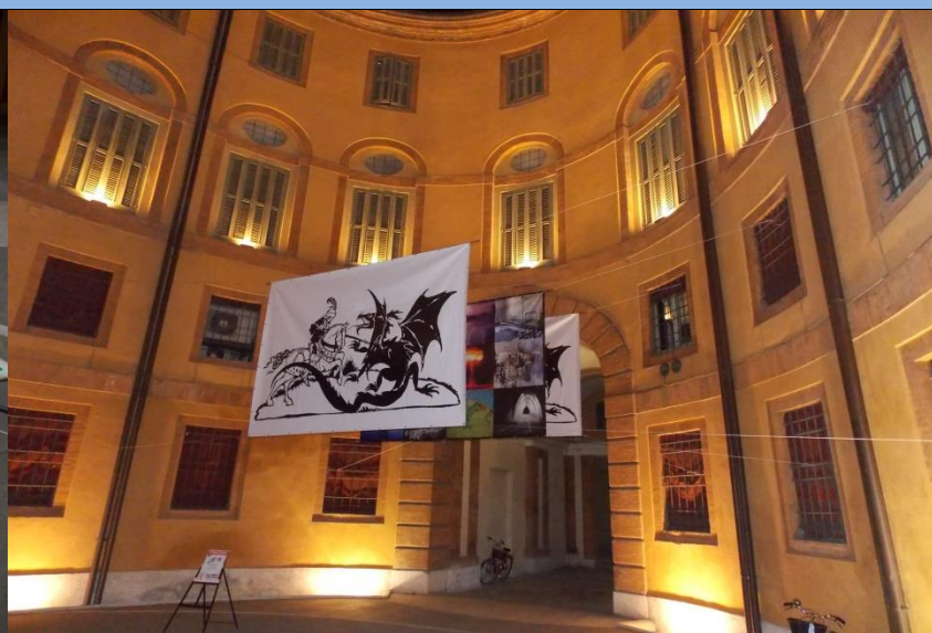
Ferrara Italija, Rotonda Foschini